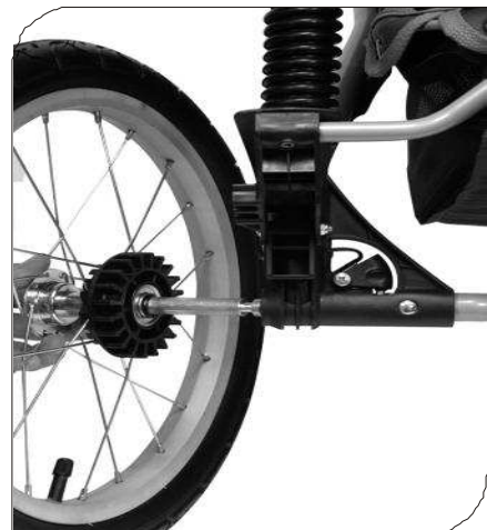
Dźwignia szybkiego montażu

Uchwyć tylne koło w jednej ręce, włóż oś koła w otwór w tylnej ramie. Naciśnij i odblokuj dźwignię tak aby koło było dokładnie włożone. Pociągnij koło powoli, koło nie powinno się ruszać. Powtórz czynność z drugim kołem.